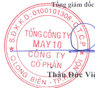
Thần Đức Việt